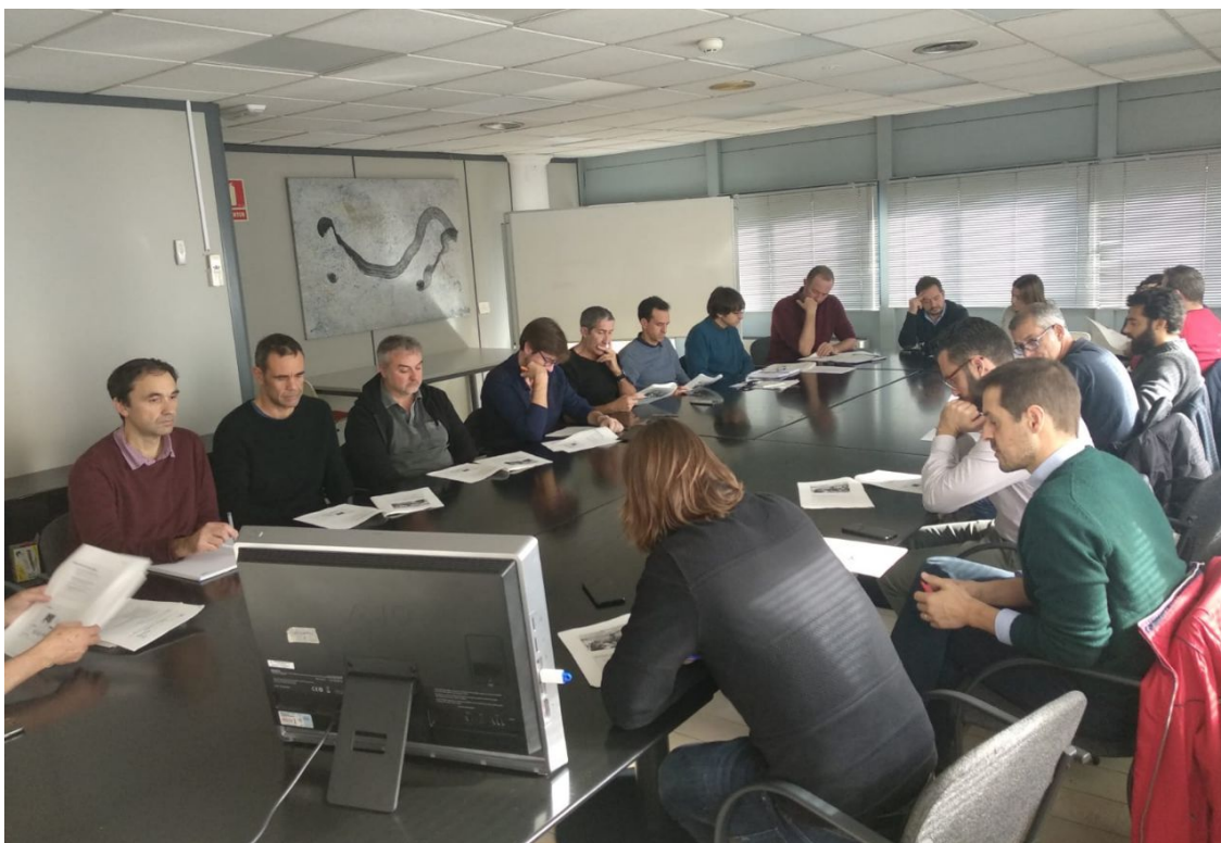
Segona reunió d'impuls del SIG municipal ( 22 de novembre de 2018)

Actualment no existeix un SIG comú a tot l'Ajuntament. La falta d'homogeneïtat dificulta el flux d'informació entre àrees i l'explotació de la informació disponible per la qual cosa no es compta amb estàndard d'eines de SIG corporatiu. Existeix molta dificultat per a utilitzar informació georeferenciada en aplicacions de gestió. No existeix una infraestructura de dades espacial local i/o Geoportal, i es dona infrautilització de la informació disponible, redundància de desenvolupaments i dades entre els diferents SIG.