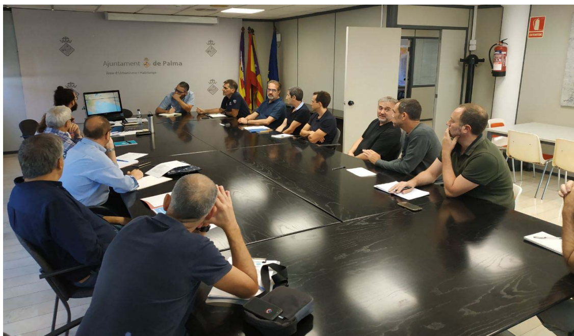
Primera reunió d'impuls del SIG municipal (4 d'octubre de 2018)

L'eficiència en la planificació, la gestió i l'administració d'un territori, dels seus serveis i les seves infraestructures va estretament unida al coneixement precís i veraç de què se'n disposi. El 80% de dades que gestiona un ajuntament té un component geoespacial; és a dir, que es pot georeferenciar al territori.